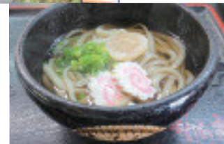
かりん亭の手打ちうどん