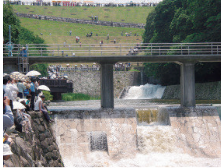
ゆるぬぎの賑わい