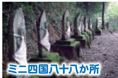
ミニ四国八十八か所

心にやすらぎを求めて八十八箇所のお遍路をしたいと思われる方に、四国霊場のミニ霊場をご紹介します。一巡が約一時間で巡拝できますし、それぞれの箇所には、各霊場の砂が捲かれて各札所の本尊が立ち並んでいます。