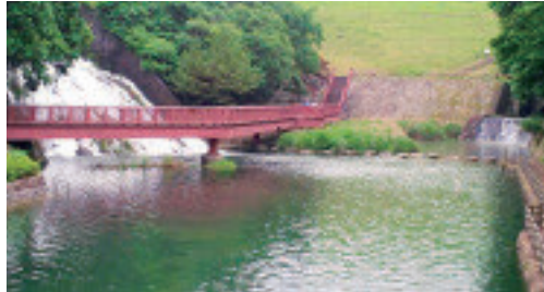
満濃池が満水となり、余水吐きから金倉川へ流れ出るときにだけ現れる幻の滝

満濃池は人が造ったもので、水をためているダムです。大きさは日本最大級で、手を広げたような形の池の貯水量は、オリンピックプールの6,160杯分に相当する15,400,000m 3 。周囲は約20km、水深約22m、灌漑面積3000haになります。今から1,200年前に弘法大師空海が考案し、今も使われている仕組みに、水の圧力を分散させるアーチ型の堤と水位が一定以上とならないよう、余分な水を下流に放流する余水吐きがあります。