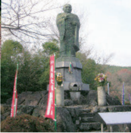
神野寺は空海が建てた別格17番札所で空海の銅像があります。